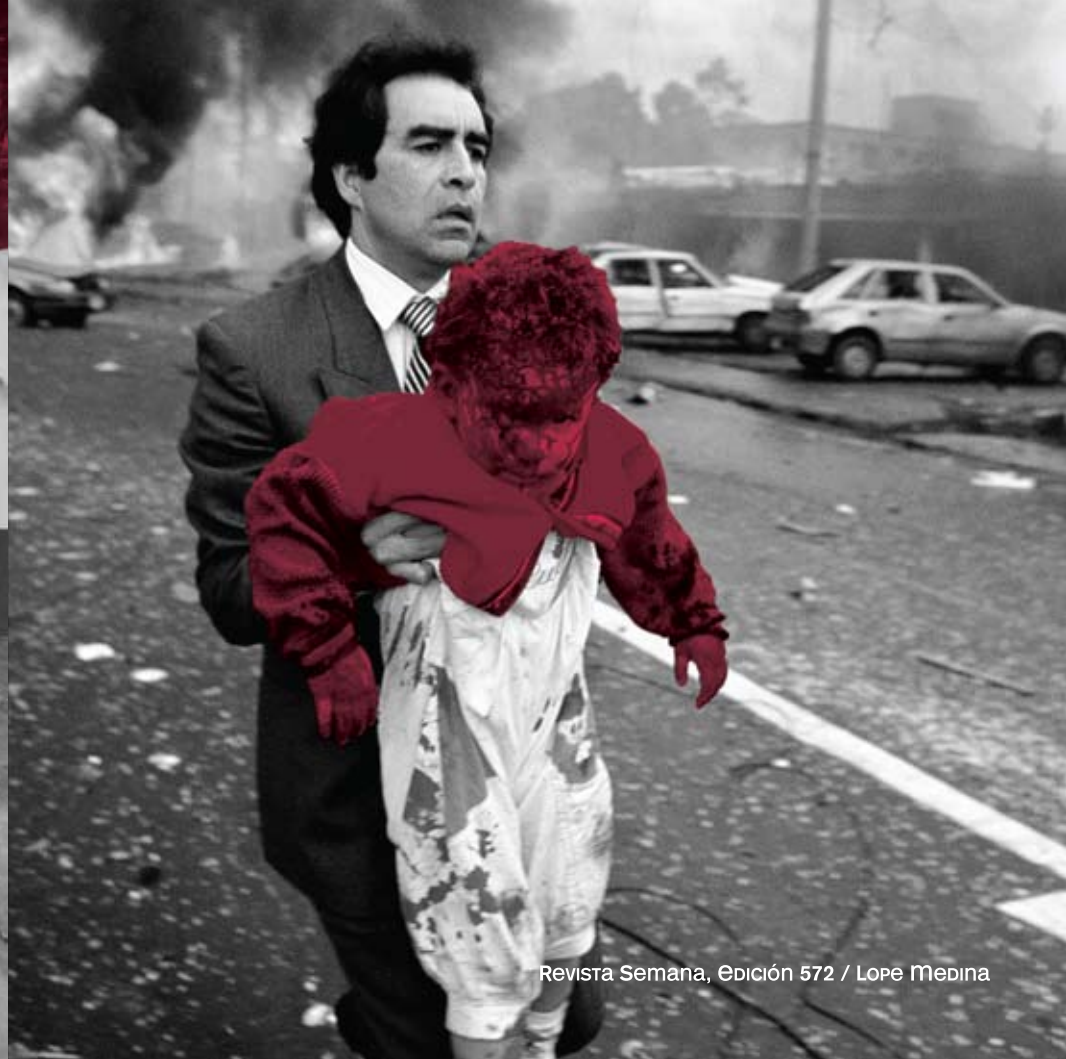
Revista Semana, Edición 572 / Lope Medina